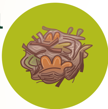
Yesca – varitas pequeñas, hojas, hierba o agujas secas.