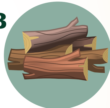
Leña – piezas más grandes de madera seca hasta de 10" de diámetro.